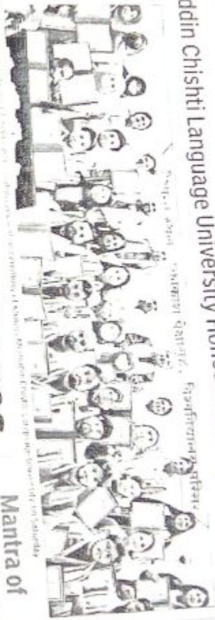
Students of Khwaja Moinuddin Chishti Language University receiving awards from the university on Saturday.