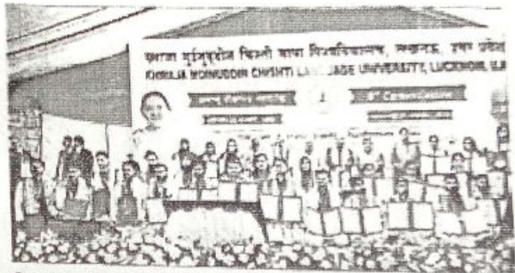
Governor Anandiben Patel with the medal winners.

Addressing the convocation, the chancellor told the degree/medal recipients about the