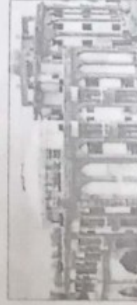
शहर के कई प्रमुख शैक्षणिक संस्थान ललवि वि से संबद्ध हो जाएंगे।

वर्ष 2013 में भाषा विवि की स्थापना के समय राज्य विश्वविद्यालय अधिनियम की धारा 7 ख में प्रावधान किया गया था कि राज्य सरकार के प्राधिकृत करने पर विवि को