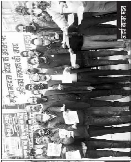
अनिवार्य मातृदाता की शपथ