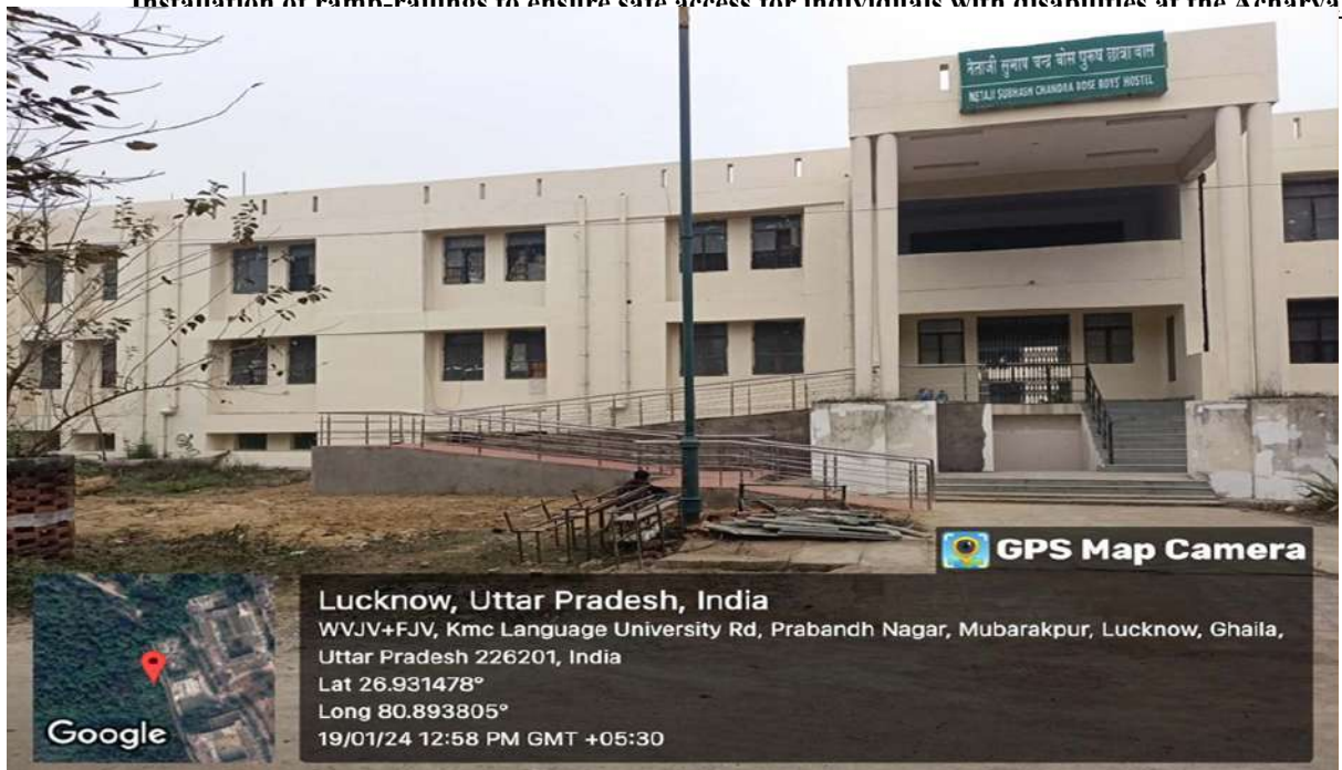
Ramps and Rallings at Boys' Hostel

Installation of ramp-railings to ensure safe access for individuals with disabilities at the Acharya