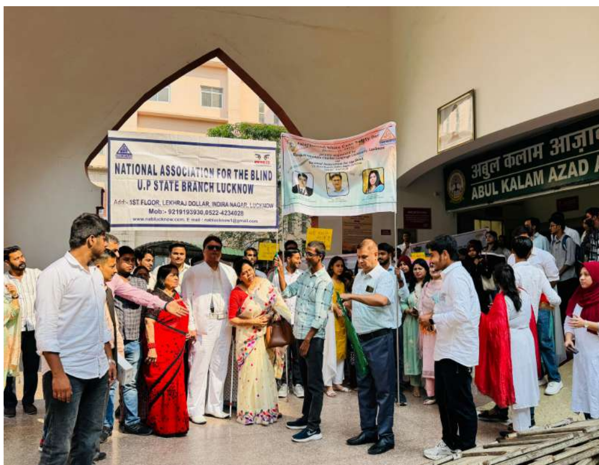
University organised White Cane Day in collaboration with National Association for the Blind U.P State Branch Lucknow

Awareness lectures and interactive sessions were organized to promote empathy and strengthen the culture of inclusivity on campus. The event conveyed a strong message that educational institutions play a vital role in creating an accessible and supportive environment for all.