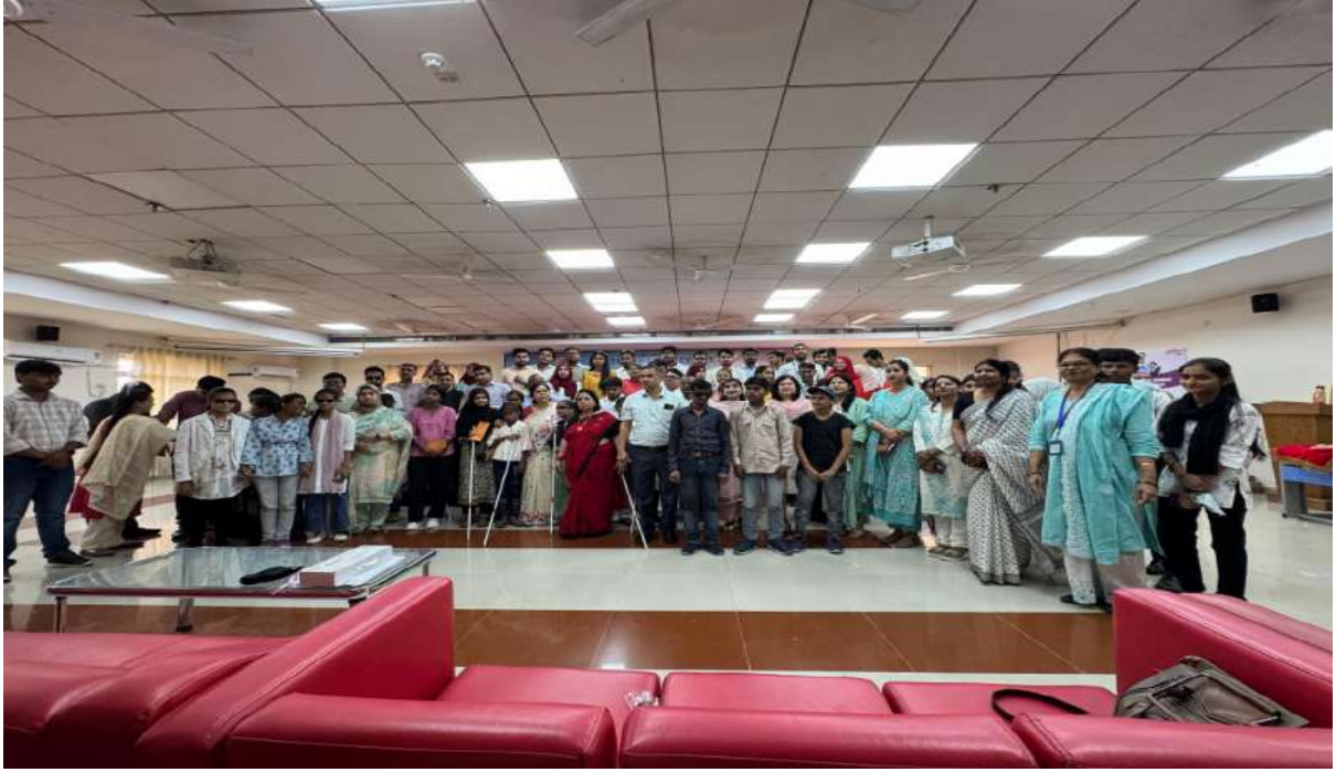
Enthusiastic participation by faculty and students on the occasion of White Cane Safety Day

Organized by the Department of Business Administration (DPMT), the event brought together students, faculty members, and visually impaired participants to promote awareness, inclusivity, and equal opportunities. The program emphasized empathy, accessibility, and empowerment for persons with visual impairments. Through this initiative, the department reaffirmed its commitment to fostering an inclusive and supportive academic environment for all.