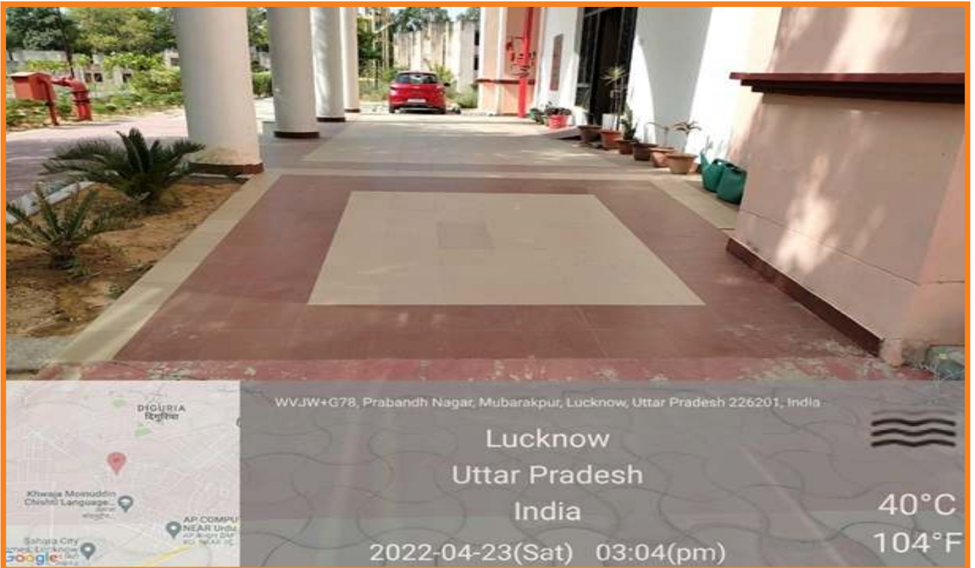
Provision of Ramp in the Ganesh Shankar Vidyarthi Centre Building for Divyangjan