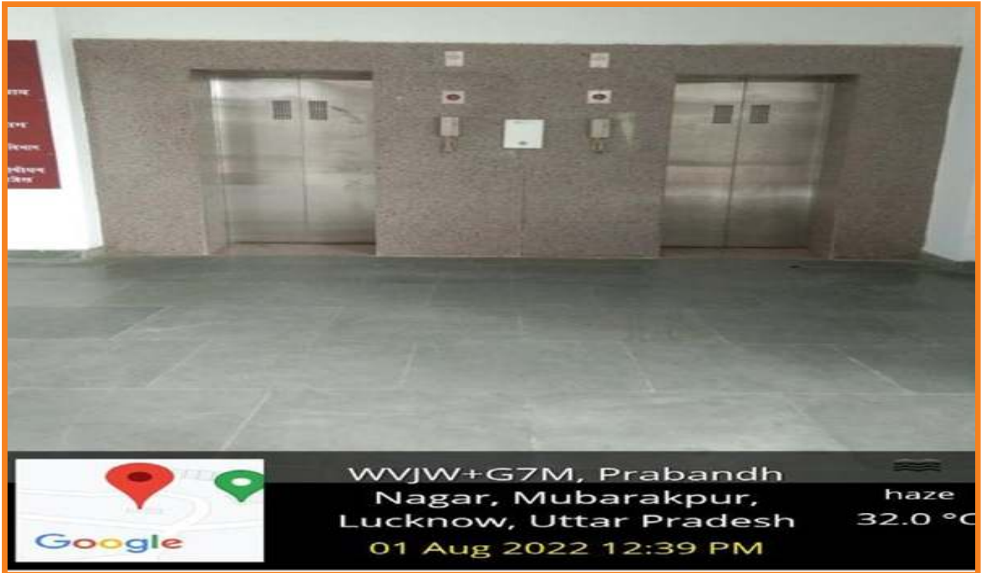
Provision of lift in Campus Buildings