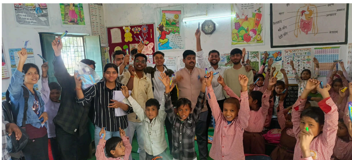
Distribution of Stationery Items to Students in schools of adopted villages