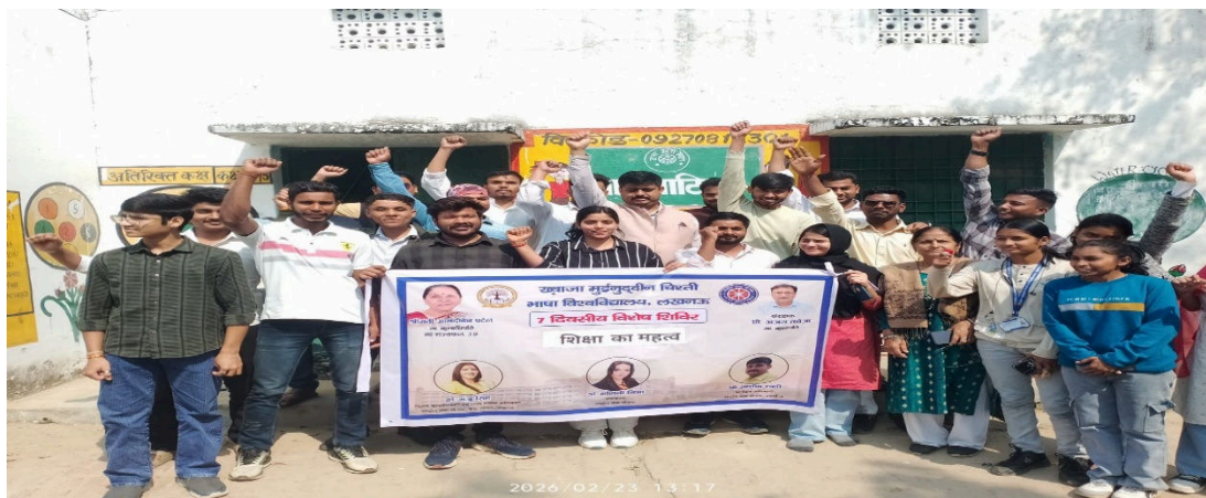
Awareness campaign on the Importance of Education organised by NSS Volunteers

Additionally, under the Community Education Support initiative, stationery items were distributed in schools of the adopted villages, and a Book Donation Campaign was organized at KMCLU to encourage knowledge sharing and support students with essential educational resources.