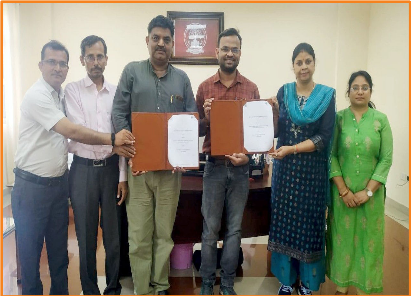
Signing of MoU between Khwaja Moinuddin Chishti Language University and Samadhan Life Science Lucknow (31 May 2023)