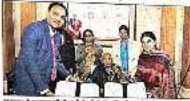
राज्यपाल श्री कल्याण सिंह ने दिल्ली के विश्वविद्यालयों में नवाचार के माध्यम से शिक्षण और शोध दोनों के क्षेत्र में नवाचार को प्रोत्साहित करने का आग्रह किया।